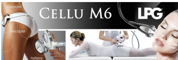
SOINS MINCEUR & ANTI-AGE - VISAGE & CORPS